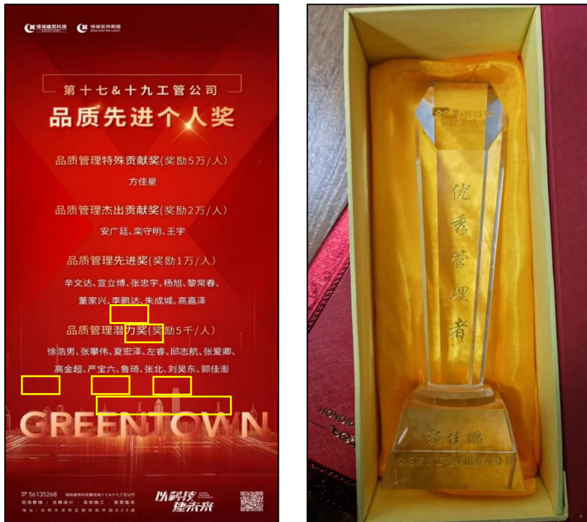
图 1 学生在企业获奖情况

生 25 人，19 级实习生 23 名，18 级实习生 10 名，17 级实习生 13 人，累计签订就业协议 36 人。学生在实习及工作中表现优异，获得公司好评及项目奖励。2022 年 8 月双方签署“教师企业实践基地”。学校每年派遣 1—2 名专业教师利用假期或业余时间，到项目或公司参加企业实践锻炼，增强行业实践能力，提升教学质量。