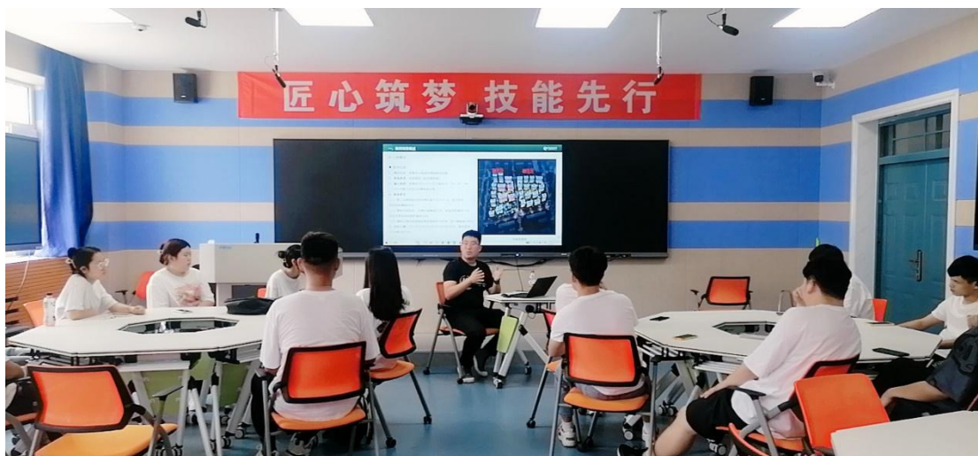
图6 企业导师在智慧教室授课