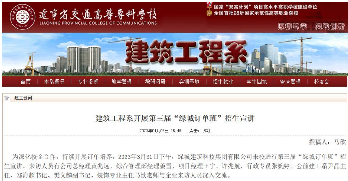
图 5 订单班开班仪式系内新闻发布

此次订单班招生宣讲，标志着我校与绿城建筑科技集团校企合作的进一步深化，双方将共同研究人才培养方案、开发课程标准、共同打造师资团队、共同建立企业人才培训基地，为装饰行业提质培优和快速发展提供人才保障。