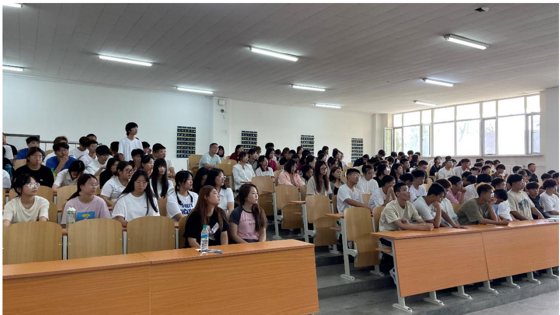
图 12 新生提问环节