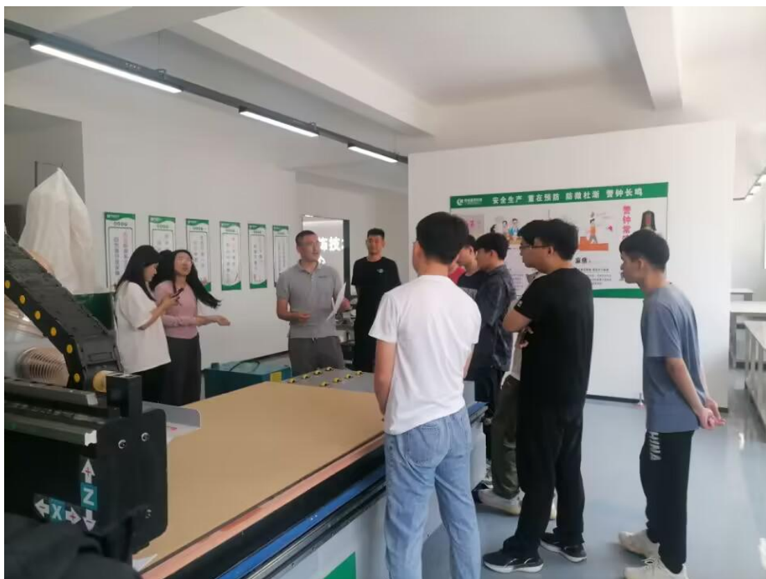
图 13 企业导师在实训室进行岗位工作讲解

宣讲堂等功能。学生在校期间通过实训，反复练习相应工种的操作，认知施工常用装饰材料、工艺做法、新技术应用，掌握相应分部分项工程质量验收方法，掌握施工项目现场安全文明施工要求，提高学生动手操作能力，达到专业人才培养目标。