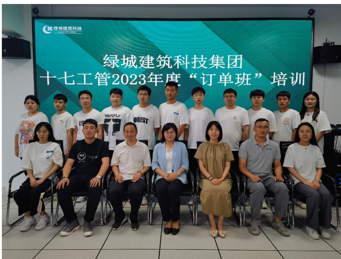
图7 订单班培训合影

通过本次岗前培训，订单班的学生们初步掌握了关于施工的整体流程及相关的工艺工法，同时对绿城集团企业有了更深的了解，也对自己的就业理念及未来的规划有了初步的认知。将新员工培训和技能