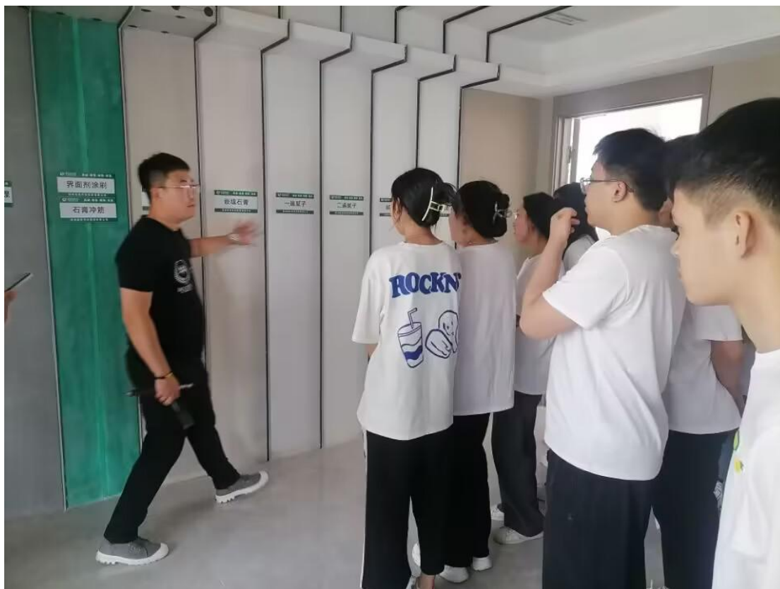
图 14 企业导师在实训室进行施工工艺讲解

公司在施工淡季选派一些技术精湛的产业工人来校指导学生练习工种的操作，在学生实习前，让学生掌握基本工种的操作方法，在练习中掌握工种做法，认识材料、同时掌握了质量验收的方法，缩短学生实际岗位工作时候的适应时间。学生素质提高了，用人单位校招整体素质也会不断提升，达到双方合作的预期目的，促进学生实习、就业工作开展。