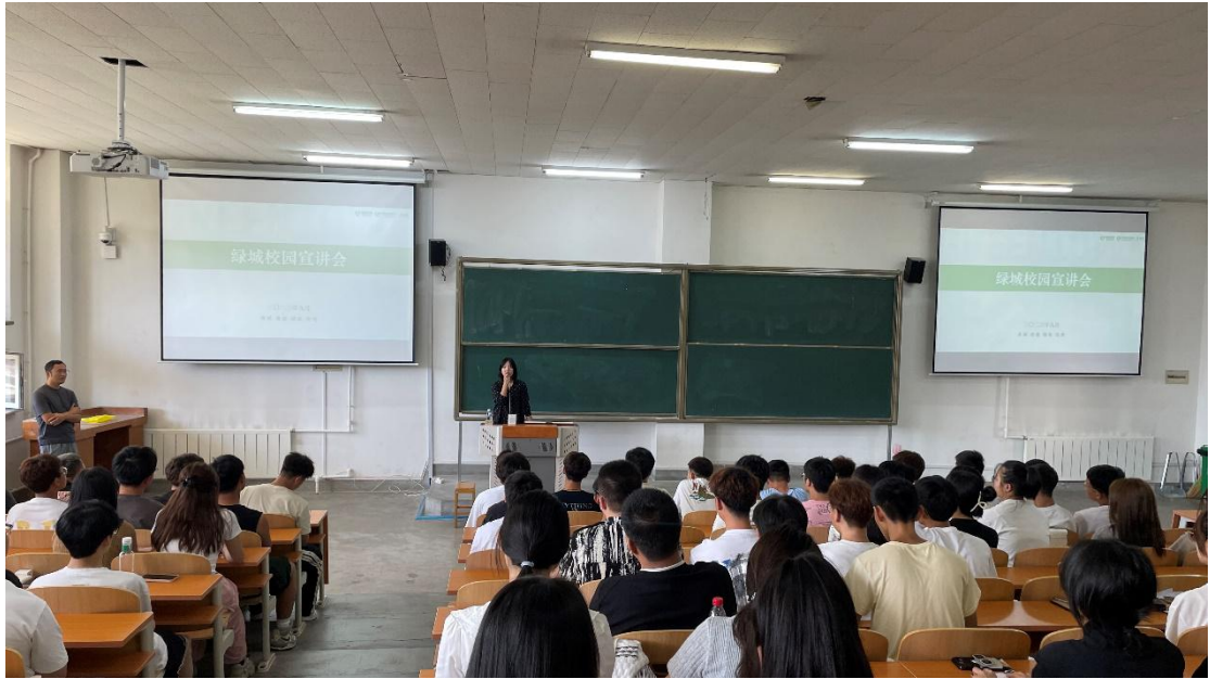
图 11 新生入学教育