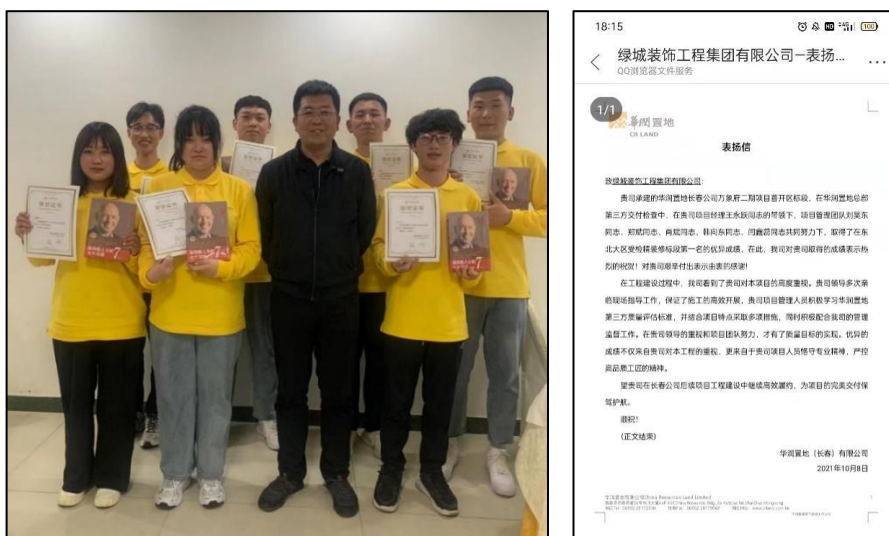
图 2 学生在企业获奖情况